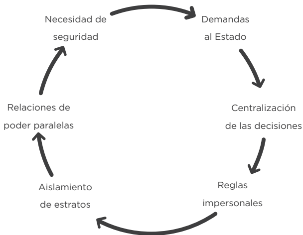
Figura 1. El círculo vicioso de Crozier